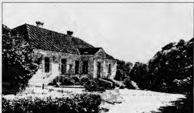
Дом-музей Міцкевіча ў Навагрудку.

ючыся да Міцкевіча, з папрокам пісала: “Вы для Літвы, а не для Кароны пішаце...”, менш за ўсё клапоціўся аб тым, ці будзе вас разумець у Варшаве, абы разумелі ў Літве”.