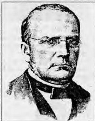
Кампазітар Станіслаў Манюшка.

шым месцы знаходзілася балада “Свіцязьняк” на тэкст Міцкевіча. Выпушчана 12 такіх песеннікаў, і ў кожным з іх сустракаюцца творы на словы паэта. А шосты зборнік цалкам прысвечаны творам Міцкевіча.