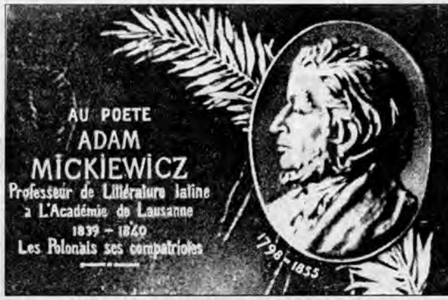
Мемарыяльная дошка Міцкевічу ў Лазане (Швейцарыя).

Яшчэ ў 1822 годзе адна з польскіх газет, звярта-