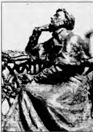
Так будзе выглядаць помнік Міцкевічу ў Мінску.

Аляксандр Аляб’еў першы з рускіх кампазітараў увавасібіў у музыцы верш Міцкевіча “К ДД.”. Налічваецца да двух дзесяткаў перакладаў гэтага верша на рускую мову і многа музычных інтэрпрэтацый яго. Чайкоўскі, Кюі, Рымскі-Корсакаў напісалі рамансы на гэты верш, а Глінка сачыніў раманс-мазурку. Вось так: адзін верш, а музычных твораў